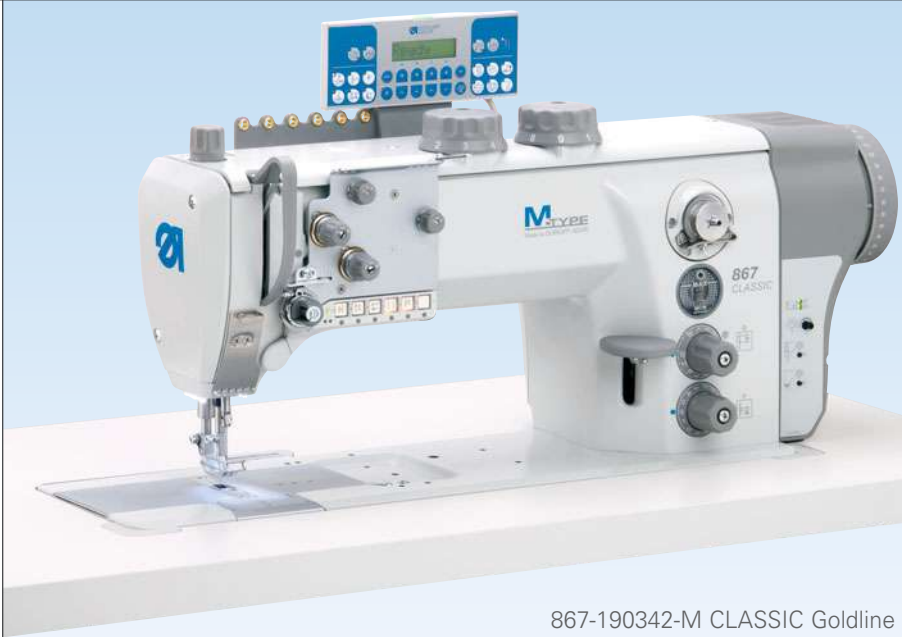
867-190342-M CLASSIC Goldline

Die leistungsstarken Unterklassen / The highly efficient subclasses