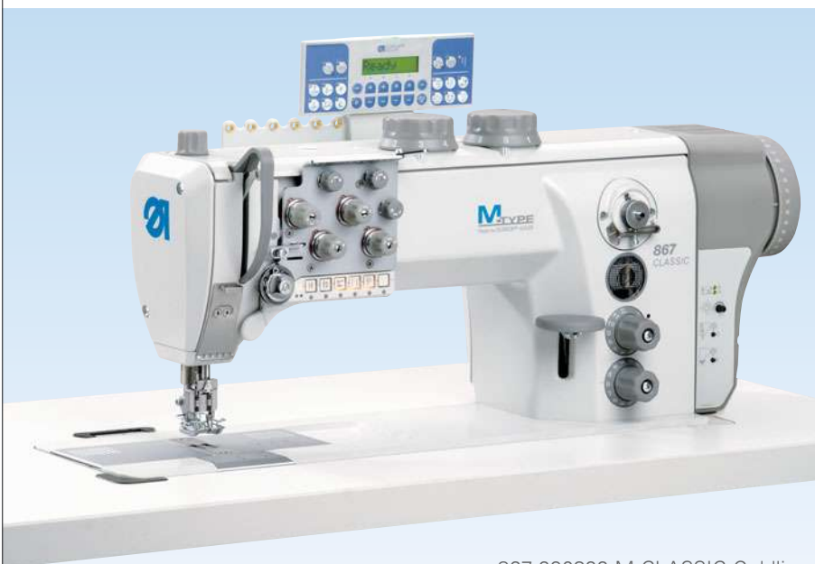
867-290322-M CLASSIC Goldline