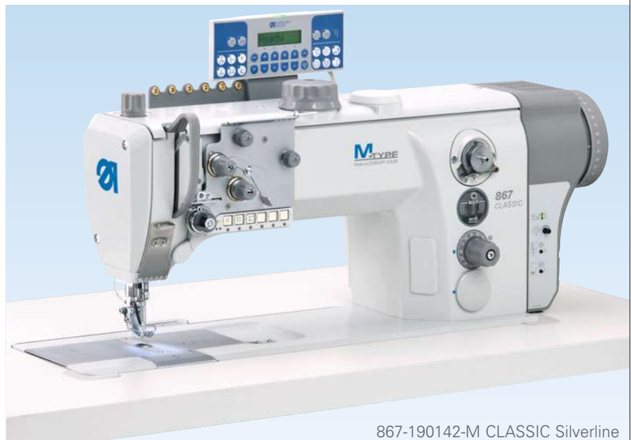
867-190142-M CLASSIC Silverline