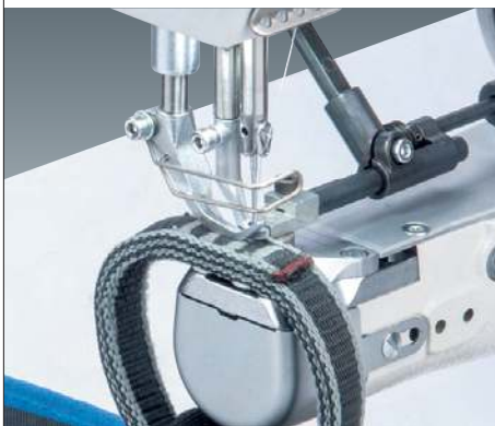
Nähergebnis ohne „MTD“ Sewing result without "MTD"